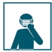
Попытайтесь односторонней маской