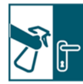
Важная уборка дома ежедневно