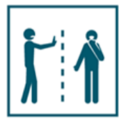
Ограничьте контакты с заболевшими людьми