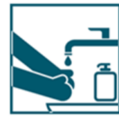
Чаще мойте руки