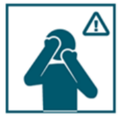
Не прикасайтесь к лицу: носу, глазам, рту