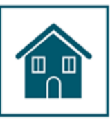
Оставайтесь дома в период болезни