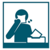
Помытьте одноразовой бумажной салфеткой при чихании, кашле, насморке

Соблюдение следующих гигиенических правил позволит существенно снизить риск заражения или дальнейшего распространения гриппа, коронавирусной инфекции и других ОРВИ.