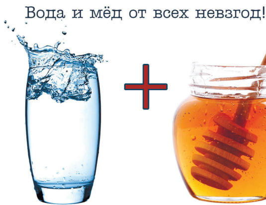
Вода и мёд от всех невзгод!

редь, способствует выводу токсинов и избавлению от лишнего веса;