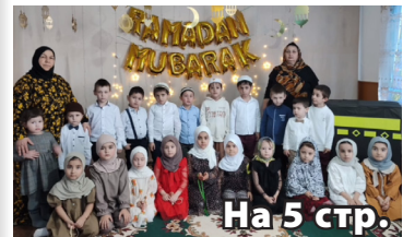
На 5 стр.

Мероприятие, посвященное Священному месяцу Рамадан