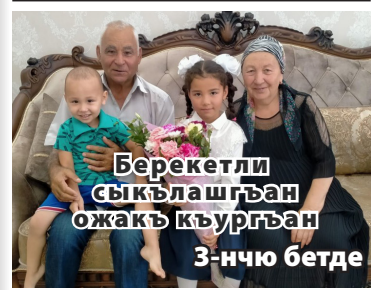
Берекетли сыкълашгъан ожакъ къургъан 3-нчю бетде