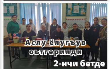
Аслу Ёлугъув ыйтгерилди 2-нчи бетде