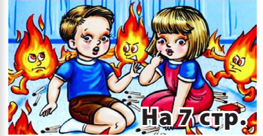
На 7 стр.