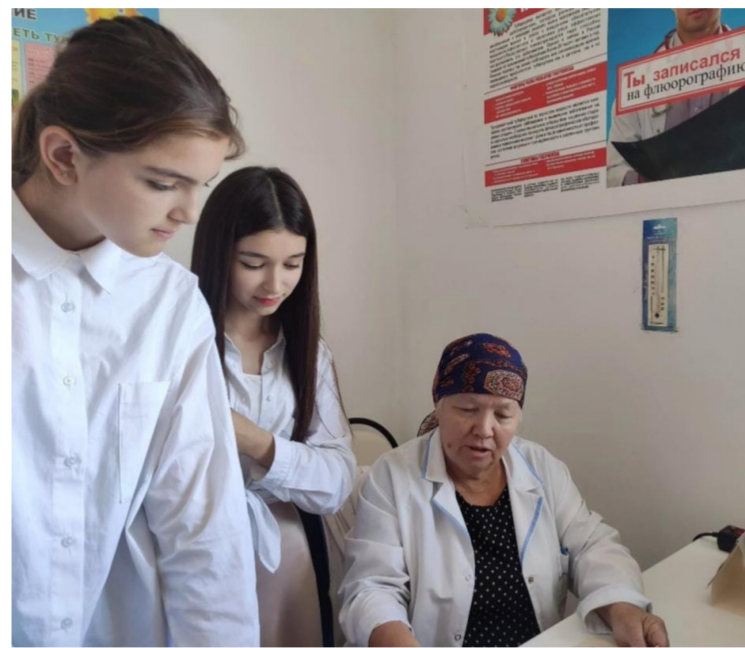
кабусуна амин болуп ишин кьургьан сынаву кьуллукьчу. Ол, медсестраны касбусун танглап, савлукь сакь-

Иылы - йлы сейлесе йылан да кебин чечер дегенлей, Валентина аврувгьа исси иржайыву ва йылы селзери булан янашып, ону гьнгюн алып, ругьун гьтере. В. Гьажигишиева ишинде елугьа-на четимликге чул бермей, бойнуна алгьан борчларына уьстенсву