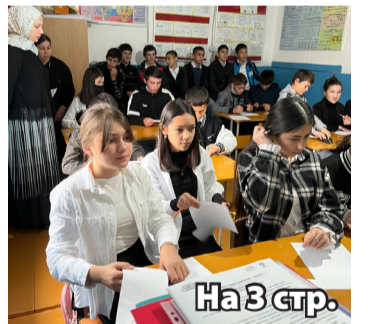
На 3 стр.