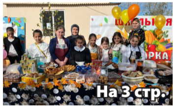
На 3 стр.