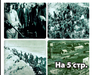
На 5 стр.