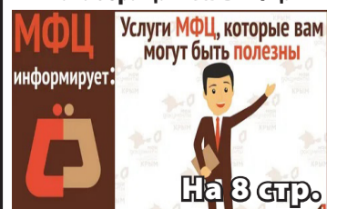
На 8 стр.

Хотите стать индивидуальным предпринимателем, но не знаете как? Обращайтесь в МФЦ!