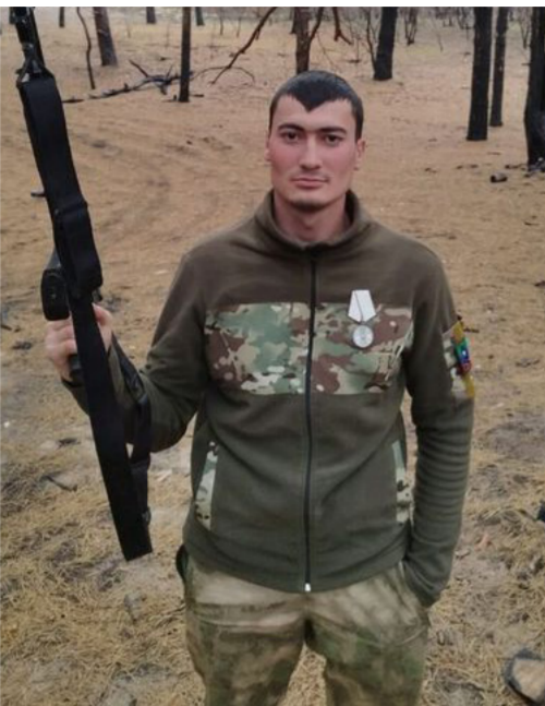
Ёлдашлары учун лап сыйлы савгъат, неонацистлени утуп, устынюлюкге ес болмакчылыкъ болуп токътай.

Аскерхан Арслангереев эсгерген кюйде, савгъат - янгыз алдына салынгъан борчну кютов. Ону ва дав