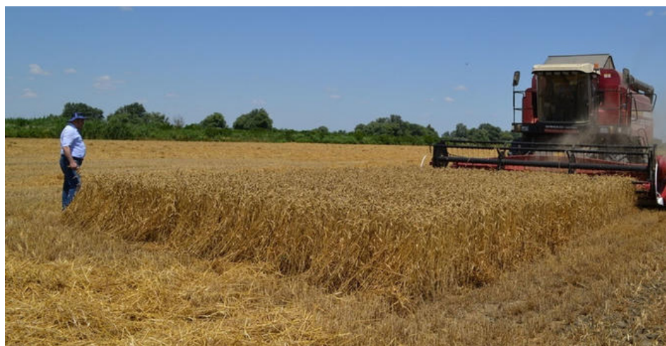
В уборочных работах задействован приобретенный по программе лизинга

было засеяно около 60 гектаров пашни. Сегодня на полях хозяйства проходит уборка озимых зерновых. Урожайность посевов хорошая, в среднем с одного гектара собирают в пределах 35 центнеров зерна.