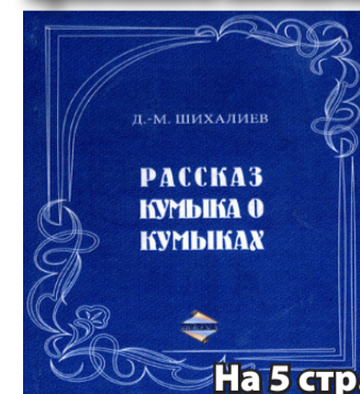
На 5 стр.