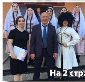
На 2 стр.

Наш земляк достойно представляет Дагестан в Новгородской области