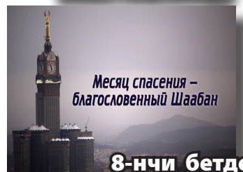
Месяц спасения – благословенный Шаабан