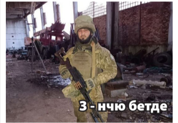
3 - нчю бетде