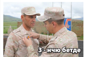
3 - нчю бетде