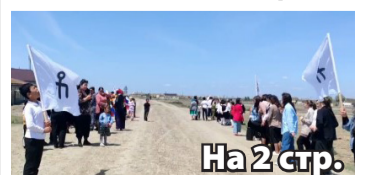
На 2 стр.

Новая Коса стал местом встречи участников 3-го Всеногайского конного перехода