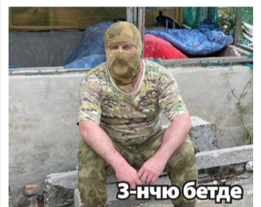
3 - нчю бетде

Эсделик (Телекъай Мамашевни 95 йыллыгына)